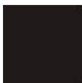
IČ (intenzivně černá) RAL 9005