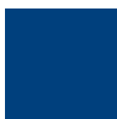
MO (tmavě modrá) RAL 5010

Uvedené barvy jsou ovlivněné nastavením Vašeho monitoru a mohou se mírně lišit od skutečných. Pro kontrolu reálné barevnosti použijte vzorník plechů nebo vzorník barev RAL.