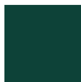
MZ (mechově zelená) RAL 6005