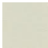
ŠB (šedo bílá) RAL 9002