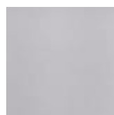
BH (bílo hliníková) RAL 9006