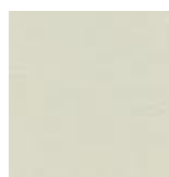
ŠB (šedo bílá) RAL 9002