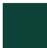
MZ (mechově zelená) RAL 6005